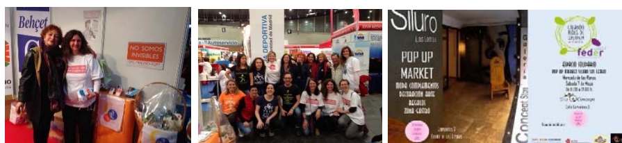
1. y 2. EXPODEPORTE. 3. Cartel Mercado de las Ranas.