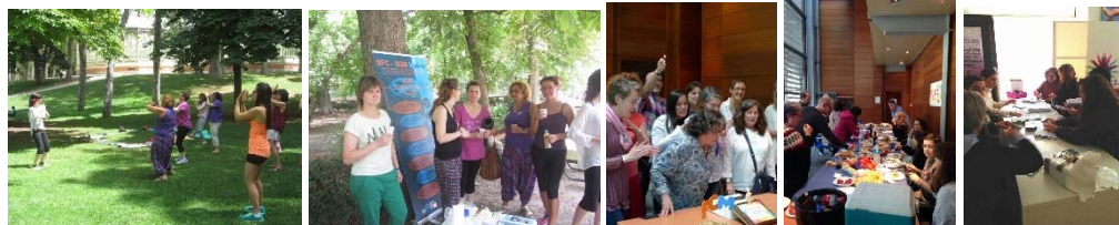
1 y 2. Encuentro Cuerpo y Mente en El Parque del Retiro. 3. Celebración del 6º cumpleaños de SFC-SQM Madrid. 4. Comida participativa de Navidad. 5. Ensobrado para la Campaña Informativa a médicos.